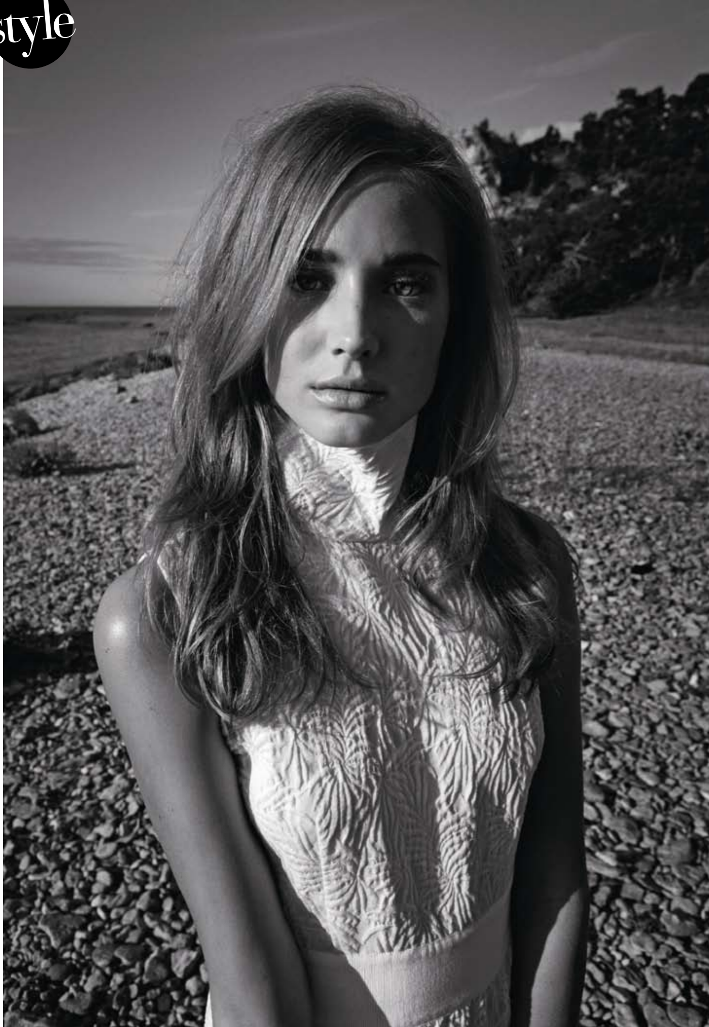
Linke Seite: Cocktailkleid aus einem Woll-Seiden-Gemisch, GIAMBATTISTA VALLI. Rechte Seite: blusfarbener Bolero aus Federn, GALEOTTI PIUME. Chiffonrock, ALBERTA FERRETTI.