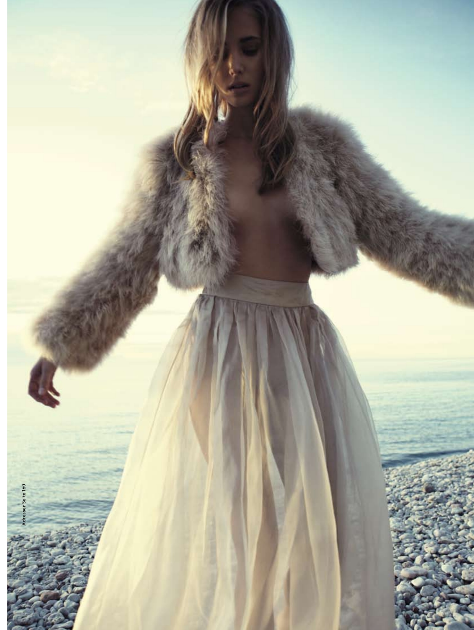
Adressen Seite 160