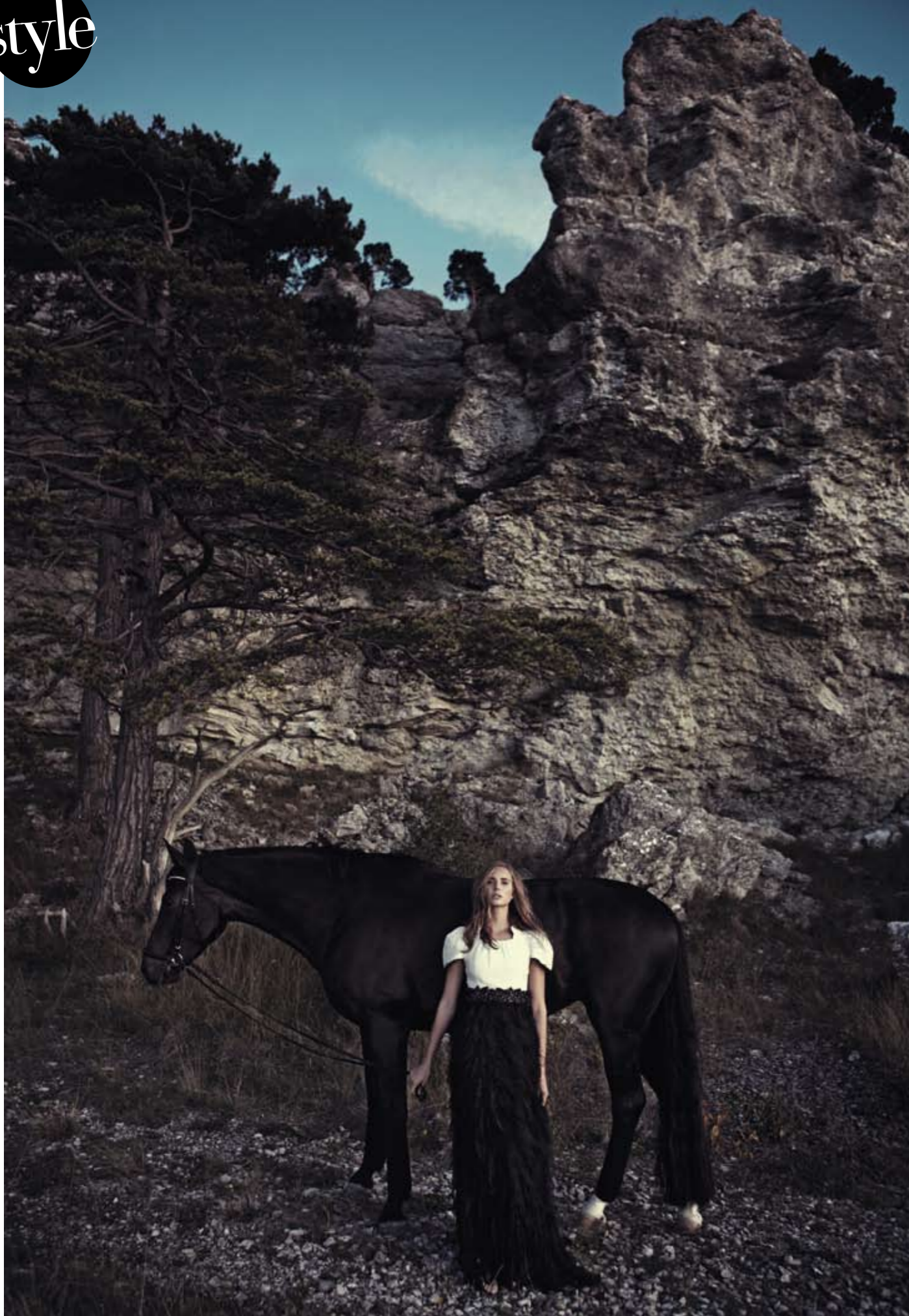
Linke Seite: Rock aus geknüpften Voile-Bändern, Oberteil mit Flügelärmeln, CHANEL. Rechte Seite: Jacke aus weissen Federn, GALEOTTI PIUME.