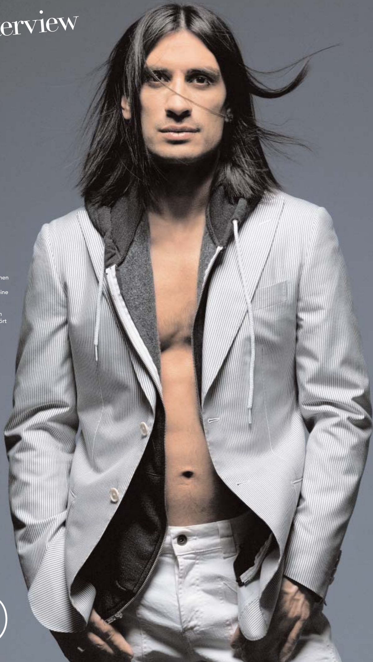
Vorangehende Doppelseite und kleine Bilder rechts: rot-weiss gestreiftes Polo-Shirt und beige Hose, beides aus Leinen, von CRISTIANO FISSORE , bei Blaser Market, Zürich. Wildleder-Mokassin, CAR SHOES , bei Grieder. Master Calendar mit Edelstahlgehäuse und Krokodillleder-Armband, JAEGGER-LECOULTRE , bei Türler. Linke Seite: fein gestreifter Sakko, PAL ZILERI , und weisse Stretchhose, JECKERSON , beides Berni's Uomo, Zürich. Baumwolljacke mit Kapuze, AMERICAN APPAREL .

«Der Charakter eines Menschen zeigt sich an der Art, wie er sich anzieht. Ich bevorzuge eine Mischung aus sportlich und elegant, je nach Tagesform. An einen Anlass erscheine ich immer gut gekleidet. Es gehört zu meiner Persönlichkeit, anständig angezogen zu sein.»