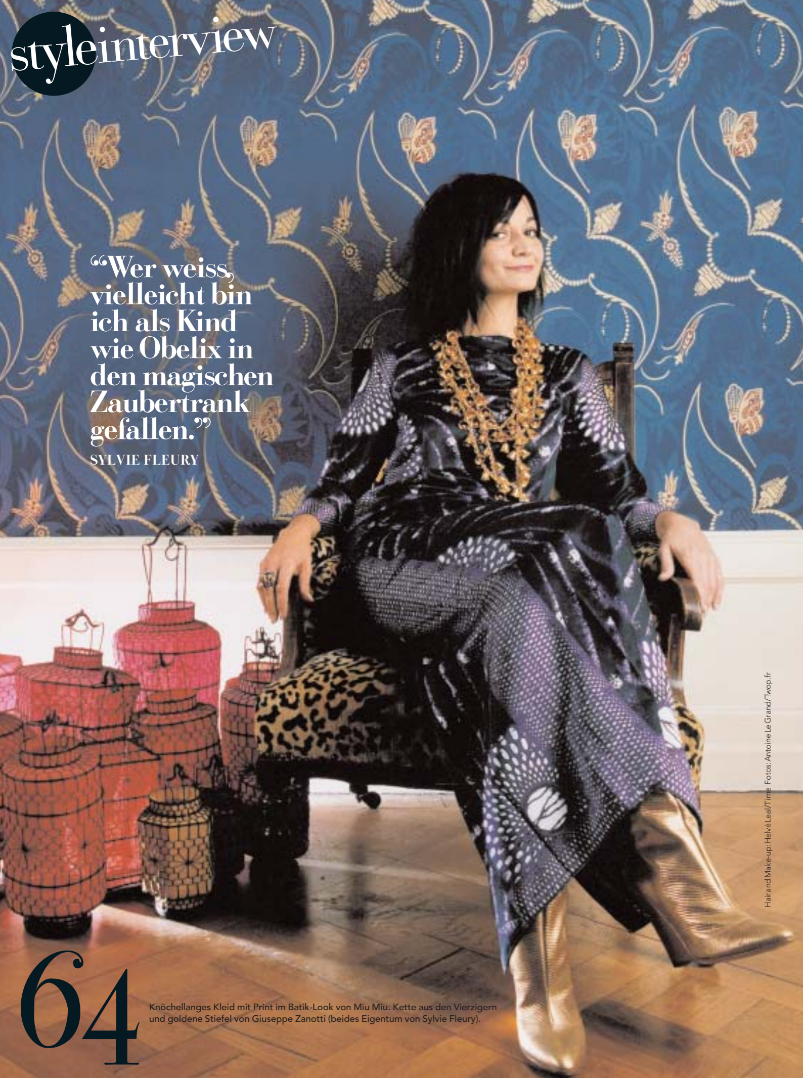
Hair and Make-up: Helvè Leal/Time.